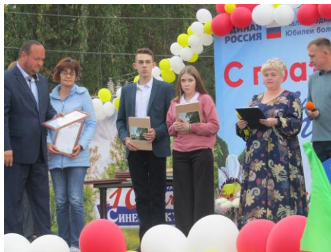
Вручаем книгу руководителям организаций Синеборской территории.