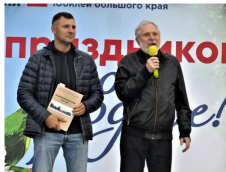
Выступают потомки основателя села Пономарёвы - Середины внук и правнук и им подарили свою книгу.

Размещены в книге «По дубенским просторам. 1829-1945 гг.» десятки фотографий, архивных документов, газетных статей.