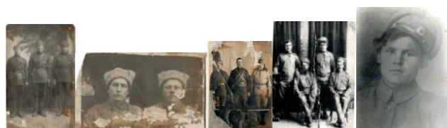
Фотографии из архива школьного музея участников 1 мировой войны, Дубенского восстания 1918 г.

Размещены в книге «По дубенским просторам. 1829-1945 гг.» десятки фотографий, архивных документов, газетных статей.