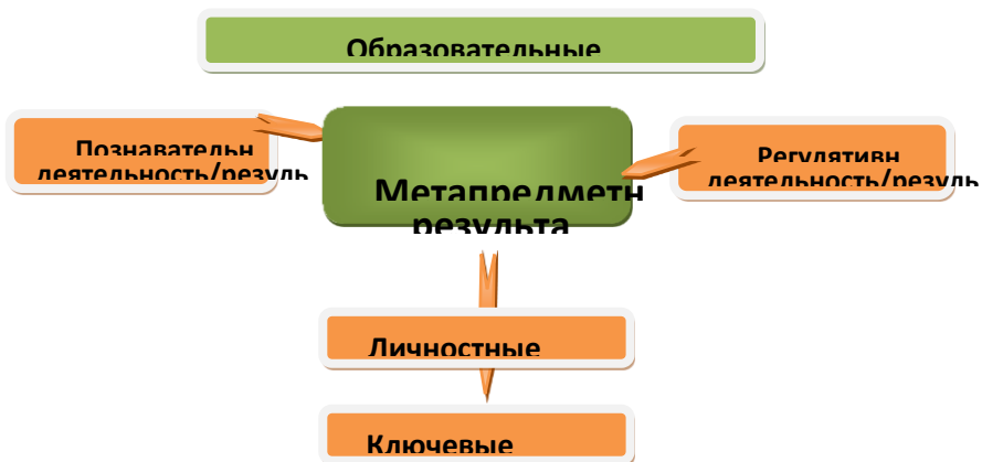
Рис. 3. Система оценки образовательных результатов

Универсальные учебные действия – основа формирования метапредметных, личностных и компетентностных образовательных результатов