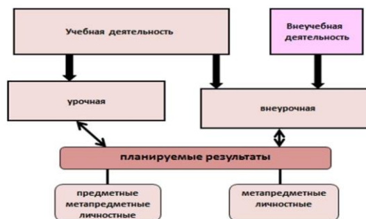
Схема организации коррекционной работы в школе

Коррекционную работу в разных организационных формах можно представить в виде схемы.